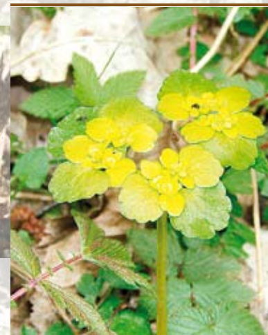
Śledziennica skrętołistna Chrysoplenium alternifolium

Na terenie rezerwatu występują 4 chronione siedliska przyrodnicze: Grąd środkowoeuropejski Galio sylvatici-Carpinetum betuli , Łęg wiązowo-jesionowy Ficario-Ulmetum minoris , Łęg jesionowo-olszowy Fraxino-Alnetum , Wysokogórskie ziołorośla i zarośla liściaste ( Adenostylion alliariae ) ziołorośla z panującym lepiężnikiem białym Petasitetum albi .