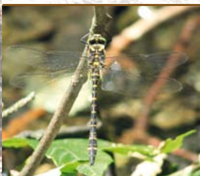
Szklarnik leśny Cordulegaster boltonii

W rezerwacie występują 104 gatunki drzew, krzewów i roślin zielnych, zśród których 7 to gatunki chronione: kopytnik pospolity Asarum europaeum , wawrzynek wilczełyko Daphne mezereum , kruszczyk szerokolistny Epipactis helleborine , kruszyna pospolita Frangula alnus , przytulia wonna (marzanka wonna) Gallium odoratum , bluszcz pospolity Hedera helix , i przyłaszczka pospolita Hepatica nobilis . Warto też wspomnieć lepiężnik biały Petasites albus , roślinę zagrożoną w skali Opolszczyzny, stanowiącą swoisty relikwitu epoki lodowcowej.